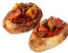
TAKAZAWA 180 ICHI HACHI MARU 商品名:バイクンコロケ ～季節の野菜のラタトゥイユ～ 価格:400 円～※季節により変動

フランスの伝統菓子「クイニー・アマン」と「タルトタン」をかけ合わせました。バターと砂糖で煮詰めたりんごをバターをたっぷり織り込んだブリオッシュフィユテで包み、カラムルでコーティングしました。