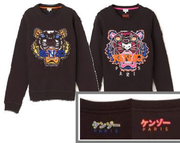
KENZO 商品名:タイガースウェット 価格:36,000 円

素材:・K18WG ・サファイア 23.10ct ・ダイヤモンド 10.96ct