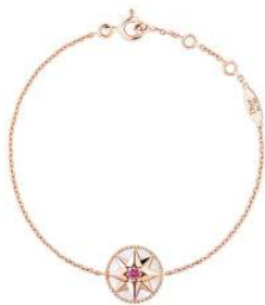
House of Dior Ginza 「Rose des Vents (ローズ デ ヴァン)」

中央通りに並ぶ路面 6 店舗(House of Dior Ginza、CÉLINE、SAINT LAURENT、Van Cleef & Arpels、VALENTINO、FENDI)では、ラグジュアリーで個性溢れる GINZA SIX 特別商品を展開します。世界最大級のコレクションを展開するシチズン、創業 120 年の着物製作所 OKANO、新潟燕三条の鋳起銅器専門店 玉川堂などでは、老舗ブランドならではの匠の技と「銀座」をかけあわせた、モダンかつ品格高い特別商品を販売します。また、フランススイーツ界の巨匠 フィリップ・コンティチーニ氏や、人気シェフの高澤義明氏は、それぞれの店で、世界中の美食家を魅了するグルメを販売するなど、各店渾身の特別商品が多数出揃い、GINZA SIX 開業を盛り上げます。