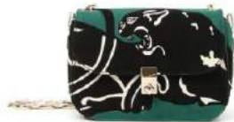
VALENTINO 商品名: VALENTINO GARAVANI ハンサーチェーンストラップ付バッグ 価格:340,000 円

ヴァン クリーフ & アーペル GINZA SIX 店ではオープンを祝い、グラフィカルなデザインの「ブトン ドール」コレクションより新たな素材を用いた作品を世界の他店に先駆けて先行発売いたします。優美なピンクゴールドと透明感のあるホワイトゴールドの組み合わせが、永遠のエleganceに満ちた二重奏を奏でます。 素材:ピンクゴールド、ホワイトゴールド、ダイヤモンド