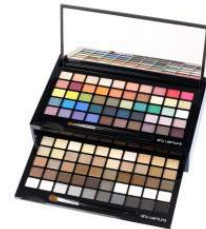
shu uemura 商品名:100色 アイシャドー パレット 価格:未定

日本庭園からインスピレーションを受け調和と静けさのバランスが絶妙なアイテム。近くの神社からの香りが落ち着きを与えてくれるヒノキの木陰の散歩を連想させるキャンドルです。 内容量:190g