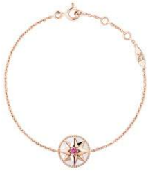
House of Dior Ginza 商品名:ブレスレット 「Rose des Vents (ローズ デ ヴァン)」 価格:190,000 円

風配図とムッシュ・ティオールが持ち歩いていたラッキースター、彼が愛した薔薇を重ね合わせたダイヤモンド。風が人生を正しい方向へ導いてくれる「ローズ デ ヴァン」は身につけたいお守りジュエリーです。 素材:ピンクゴールド、ピンクサファイヤ、マザーオブパール