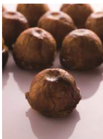
PHILIPPE CONTICINI 商品名:クイニー・タタン 価格:450 円

フランスの伝統菓子「クイニー・アマン」と「タルトタン」をかけ合わせました。バターと砂糖で煮詰めたりんごをバターをたっぷり織り込んだブリオッシュフィユテで包み、カラムルでコーティングしました。