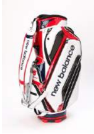
the HOUSE 商品名:<NEW BALANCE>"TOUR CADDIE BAG" GINZA SIX LIMITED EDITION 価格:52,000 円

新潟県無形文化財に指定されている鑄起銅器(ついきどうき)の技術を駆使した作品。GINZA SIX内に能楽堂が完成することを縁とし、伝統芸能と伝統工芸の融合を表現しました。 サイズ:胴高 17×胴張 20.5cm 素材:銅