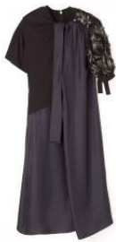
Maison Margiela 商品名:エンプロイダリードレス 価格:292,000 円

わずか 1mm 厚のムーブメントを内包する、世界最薄の光発電時計。限定セットには、つややかで風格のあるデジュー革の替えバンドをセットし、朱色の漆の箱で提供いたします。