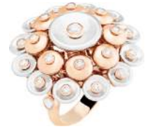
Van Cleef & Arpels 商品名:ブトン ドール リング 価格:2,250,000 円

新クリエイティブ・ディレクター アンソニー・ヴァカレロと親交の深い、モデルの ANJA RUBIK が名前の由来となっています。 サイズ:W17.5×H19×D15.5cm