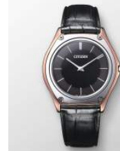
CITIZEN FLAGSHIP STORE TOKYO 商品名:Eco-Drive One CITIZEN FLAGSHIP STORE TOKYO 限定セット 価格:750,000 円

サイズ:メンズ XS~XL レディース XS~XL 素材:コットン 100% カラー展開:ブラック