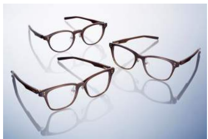
Four Nines 商品名:GINZA SIX オープニングモデル バッファローホーンフレーム 価格:170,000 円(予定)

天然素材のバッファローホーンを使用した GINZA SIX オープニングモデル。「逆 R ビンジ」など独自の高い機能性を活かしたつくりで、上品さも楽しめます。