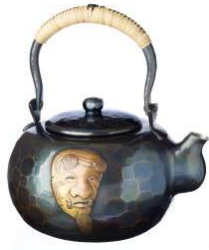
玉川堂 商品名:湯沸 口打出 翁面(2.7L) 価格:900,000 円

新潟県無形文化財に指定されている鑄起銅器(ついきどうき)の技術を駆使した作品。GINZA SIX内に能楽堂が完成することを縁とし、伝統芸能と伝統工芸の融合を表現しました。 サイズ:胴高 17×胴張 20.5cm 素材:銅