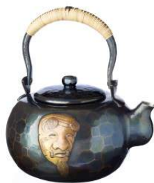
玉川堂 湯沸 口打出 翁面(2.7L)