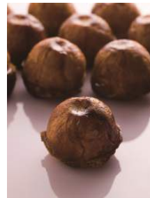
PHILIPPE CONTICINI クイニー・タタン

※特別商品のラインナップは次頁以降および別紙資料をご覧ください。価格は全て税抜です。 ※販売数量、販売方法等の詳細は各ブランドにお問い合わせください。 ※レストランの限定メニュー/特別メニューは3月中旬にリリース配信予定です。 ※記載情報は2017年2月14日時点の情報です。発売までに情報が変更される可能性があります。