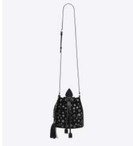
SAINT LAURENT 商品名:ANJA(アニヤ) 価格:235,000 円

風配図とムッシュ・ティオールが持ち歩いていたラッキースター、彼が愛した薔薇を重ね合わせたダイヤモンド。風が人生を正しい方向へ導いてくれる「ローズ デ ヴァン」は身につけたいお守りジュエリーです。 素材:ピンクゴールド、ピンクサファイヤ、マザーオブパール