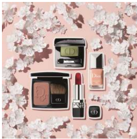
Dior BEAUTY GINZA 商品名:ルージュディオール#872 "GINZA" 価格:4,200 円

最高の気分になれる「ルージュ デイオール」より、キンザからインスピレーションをうけた限定品が誕生します。 ※写真右下