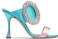
MANOLO BLAHNIK 商品名:FIBIONABI 価格:133,000 円

スワロフスキーを贅沢に使った大きいオーバル状のバックルが足元を美しく輝かせます。19 世紀後半に活躍した世界で最初のオートクチュール・デザイナー「チャールズ・ワース」からインスピレーションされた、ラグジュアリーファッションシューズと呼ぶにふさわしい一足です。