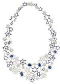
Bijou de M 商品名:Blue Stars Necklace 価格:16,000,000 円(予定)

夜空の輝く星たちをそのままネックレスにしたアイテム。光り輝く星空をブルーサファイアとダイヤモンドを贅沢に使用して表現しています。