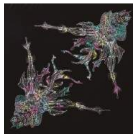
OKANO 商品名:「美しい羽 02 GINZA MARARA」 価格:マスターピース 1,280,000 円 エディション 280,000 円

サイズ:W250×H190×D90mm 素材:クロダイルレザー カラー展開:全 10 色