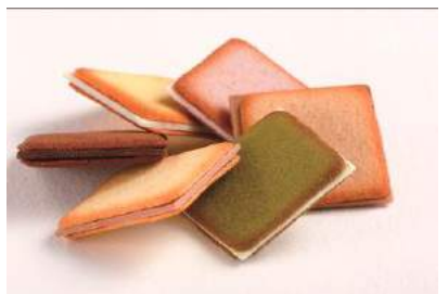
ISHIYA GINZA 商品名:SAQU LANGUES DE CHAT (サク ラング・ド・シャ) 価格:1,200 円

北海道で培われたラング・ド・シャ製造の技術を活かし、「銀座の手土産」にふさわしいラング・ド・シャとチョコレートの組合せを厳選した「SAQU」シリーズ。北海道チーズ、北海道赤ワインなど、6種類をご用意しました。 内容量:12 枚入り