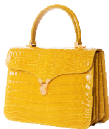
KWANPEN 商品名:折り紙ハンドバッグ 価格:700,000 円(予定)

サイズ:メンズ 44,46,48,50 素材:モヘア×ウール カラー展開:ベージュのみ