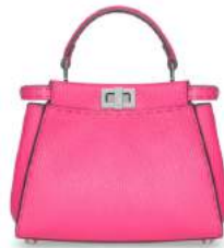
FENDI 商品名:セレリア ミニ ピーチーパー 価格:530,000 円

ヴァレンティノの、RTW コレクションに登場する「ハンサー」は、ハンドバッグをはじめ、さまざまなシーズナルスタイルに取り入れられています。このハターンには、レザーアプリケーション、レザープリント、インレイ、エンボイダリーといった異なるテクニックが用いられています。 サイズ:H15×W22×D8.5cm 素材:カーフ、スエード、ボニースキン、パイソンなど カラー展開:EMERALD