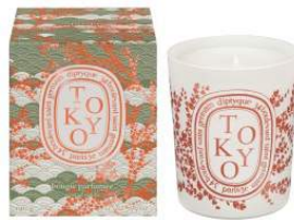
diptyque 商品名:フレグランスキャンドル Tokyo 価格:未定

最高の気分になれる「ルージュ デイオール」より、キンザからインスピレーションをうけた限定品が誕生します。 ※写真右下