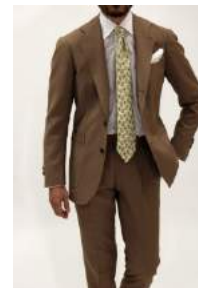
RING JACKET MEISTER GINZA 商品名:RING JACKET MEISTER206 英国 VINTAGE FABRIC スーツ 価格:250,000 円

1954 年に大阪で創業した高品質なメンズクロージングを展開する RING JACKET。既製品では取り入れられない上着上衿の後かぶせ工程によって極上の着用感を実現。