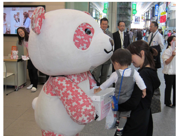
上記写真は過去の募金活動イベントのものです。

大丸松坂屋百貨店は、ピンクリボン強化月間の10月2日(水)から10月31日(木)まで、 「2013年ピンクリボンキャンペーン」を実施中です。