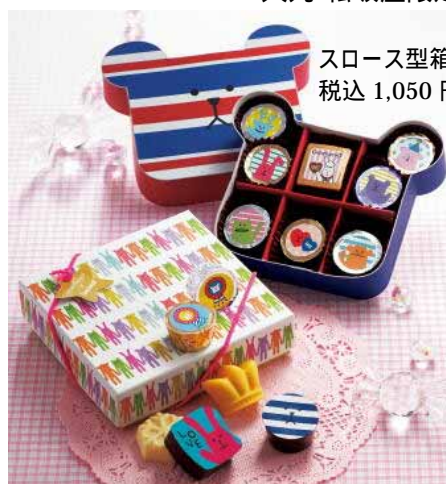
スロース型箱(8個入り) 税込 1,050円

初登場 ゆるくて甘いひとときをどうぞ！ <クラフトホリック×ゴンチャロフ> 大丸・松坂屋限定ブランド