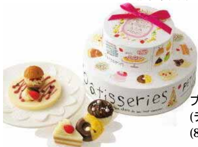
プチデザートアラモード (デコレーションケーキ箱) (8個入り)税込 2,310円

可愛いミニチュアのスイーツはぜんぶチョコ！食べるのが惜しいほど一つひとつが可愛い、チョコのスイーツたちに一目惚れパリのパティスリーをテーマにした、中川清美さんのパッケージにも注目です。