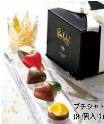
プチシャトー・エクラ (8個入り)税込 2,730円

ベルギーの伝統を活かしながら独創的な品々を生みだす、世界的なコンクールで荣誉に輝く一流ショコラティエの珠玉のアソート。大丸・松坂屋だけのキラキラ輝く限定ショコラがポイントです。