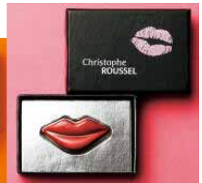
キスワン(1個)税込 735円

ショコラ界のミシュランとも称される品評会「クラブ・デ・クロクール・ド・ショコラ(C.C.C.)」で、最高評価の星付き5タブレットを2年連続で獲得した<クリストフ・ルッセル>が日本初登場！