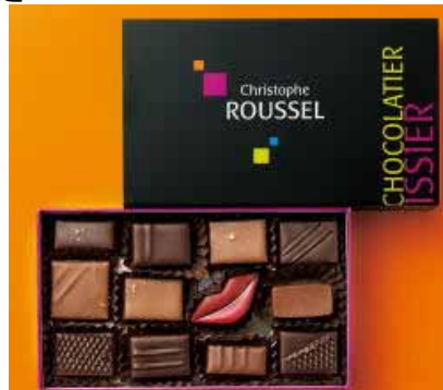
グランドチョイス(12個入り)税込 5,460円