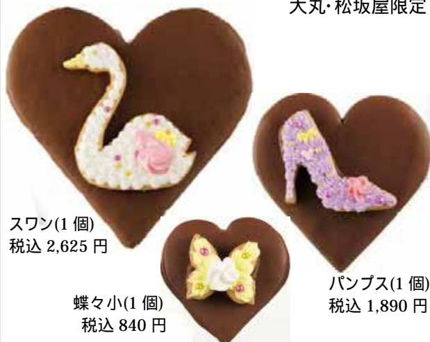
スワン(1個) 税込 2,625円

初企画 カワイイモノ好き必見のアートスイーツ <渡辺おさむさん×アンファン> 大丸・松坂屋限定