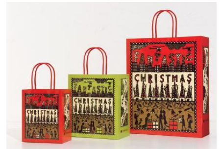
2017年ロブ・ライアン氏のビジュアルを用いたショッピングバッグ