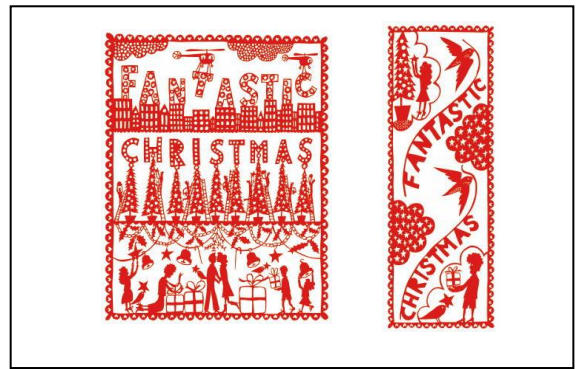
2017 年原画作品(2 点) 展示 大丸心斎橋店「北館 1 階 特設コーナー」 展示期間:11 月 15 日(水)~12 月 25 日(月)

入札は店頭の入札用紙または WEB で。※WEB での入札期間も 11 月 29 日(水)~12 月 25 日(月)