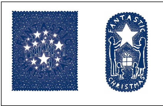
2016 年原画作品(2 点) 展示 大丸札幌店「1 階正面玄関内」 展示期間:11 月 29 日(水)~12 月 25 日(月)