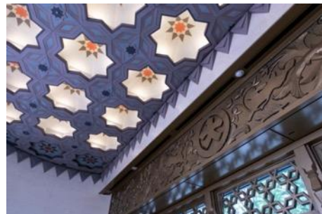
1F 御堂筋側中央玄関風除室