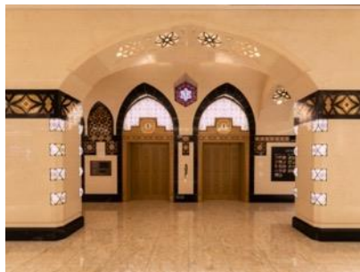
1F エレベーターホール