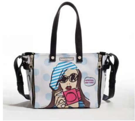
大丸京都店限定品

【COOL&MODERN】をコンセプトに国内外の最新鋭デザイナーズブランドを展開する VIA BUS STOP がセレクトしたアクセサリーの数々。ジュエリーやシューズ、バッグ等、デイリーからオケージョンまで様々なシーンを彩るアクセサリーをバリエーション豊富に展開いたします。