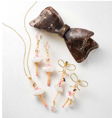
大丸京都店限定品

「アレクサンドル ドゥ パリ」のセカンドライン「ミス アレクサンドル」が京都地区初登場。ひとつひとつ職人による手作りで、使用感抜群のヘアアクセサリー。シンプルでカジュアルなアイテムや、スワロフスキーが輝くアイテムは、エレガントを演出。日々のシーンに合わせたアイテムをご用意しました。