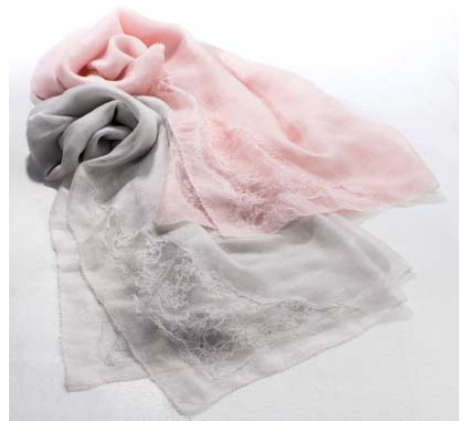
大丸京都店限定品

ラグジュアリーストールの代名詞として世界中のファッションニスタを虜にしている、ファリエロ サルティ。1949年創業のイタリアを代表する最高級テキスタイルブランドとして、世界の有名メゾンを支えてきました。そして1992年に最高級ストールのコレクションをスタートしました。ファリエロ サルティ独特のやわらかな肌触り、首に巻いた時の立体感、そして卓越した技術から生み出される細やかなディテールを有するコレクションは、セレブリティへの圧倒的な支持を得て、唯一無二のラグジュアリーストールブランドとしての地位を確立しています。