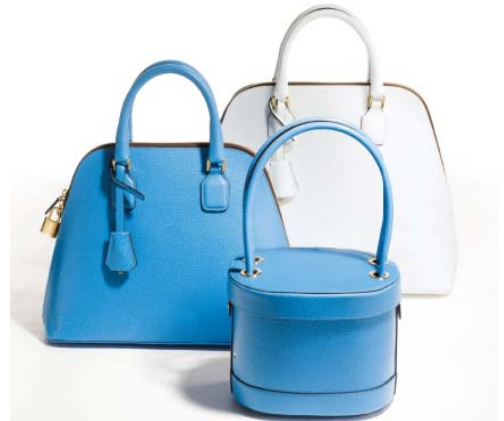
大丸京都店限定品

1976年に活動を開始し、1984年には夫妻のイニシャルを冠したブランドとしてデビュー。ジョンの英国伝統のクラフツマンシップと、モニクのフランス特有のエスプリとの融合が不思議な魅力を生み出し、その“永遠のベーシック”とさえいわれる秘密は、タイムレスなデザインに最小限のモード感を取り入れることにあります。