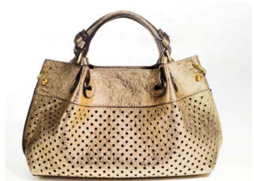
大丸京都店限定品

Made in Italyにこだわるイタリアのインポートブランド。海外有名メゾンブランドのハンドバッグ生産も担い、そのものづくりへの信頼とクオリティには高い評価を得ています。ソフト感を重視した高品質で革新的な素材にトレンドを意識した、高いデザイン性が特徴です。クオリティに裏打ちされたシックなファッションアイテムをレディース・メンズともに展開していきます。